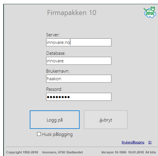
Illustrasjon 2: Serverpålogging